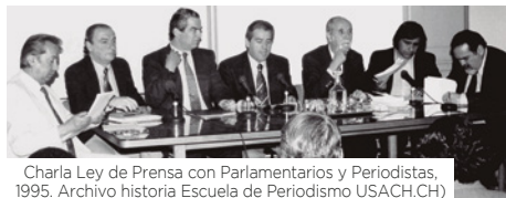
Charla Ley de Prensa con Parlamentarios y Periodistas, 1995.